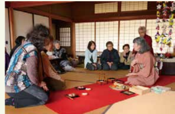
小田原歳時記「おくばりごと」の再現

(過去にご参加いただいた店舗や施設の一部をご紹介します。今年不参加の店舗も含まれています。あしからず)